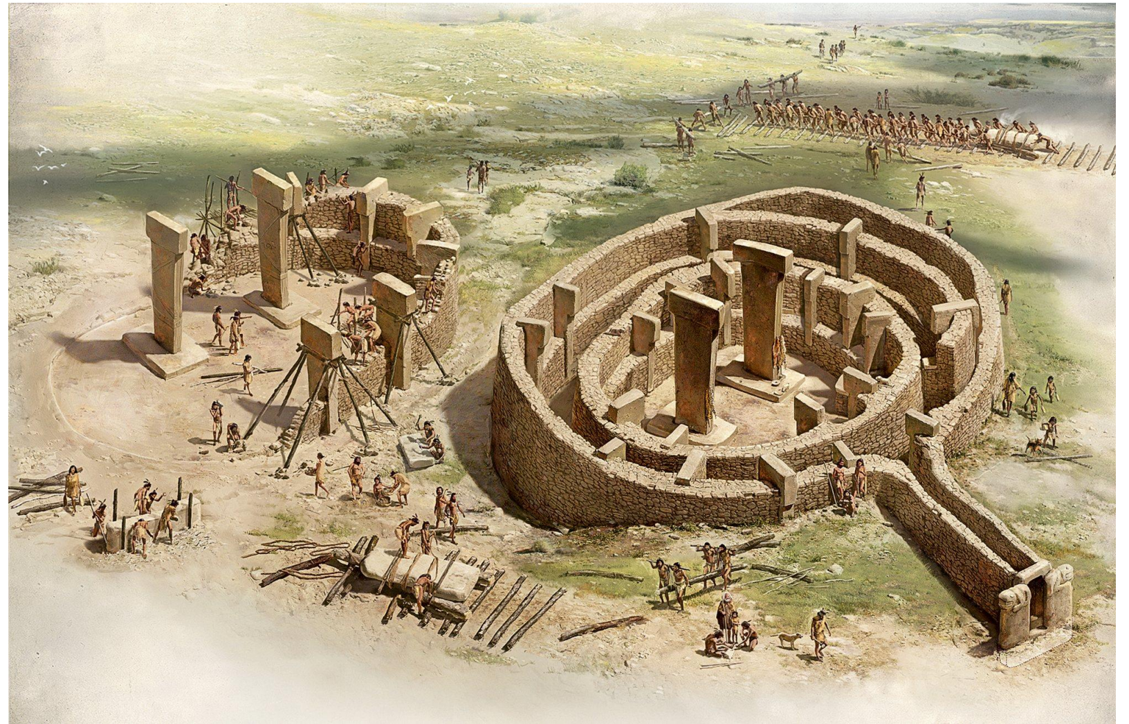
Göbekli Tepe hace 11.600 años