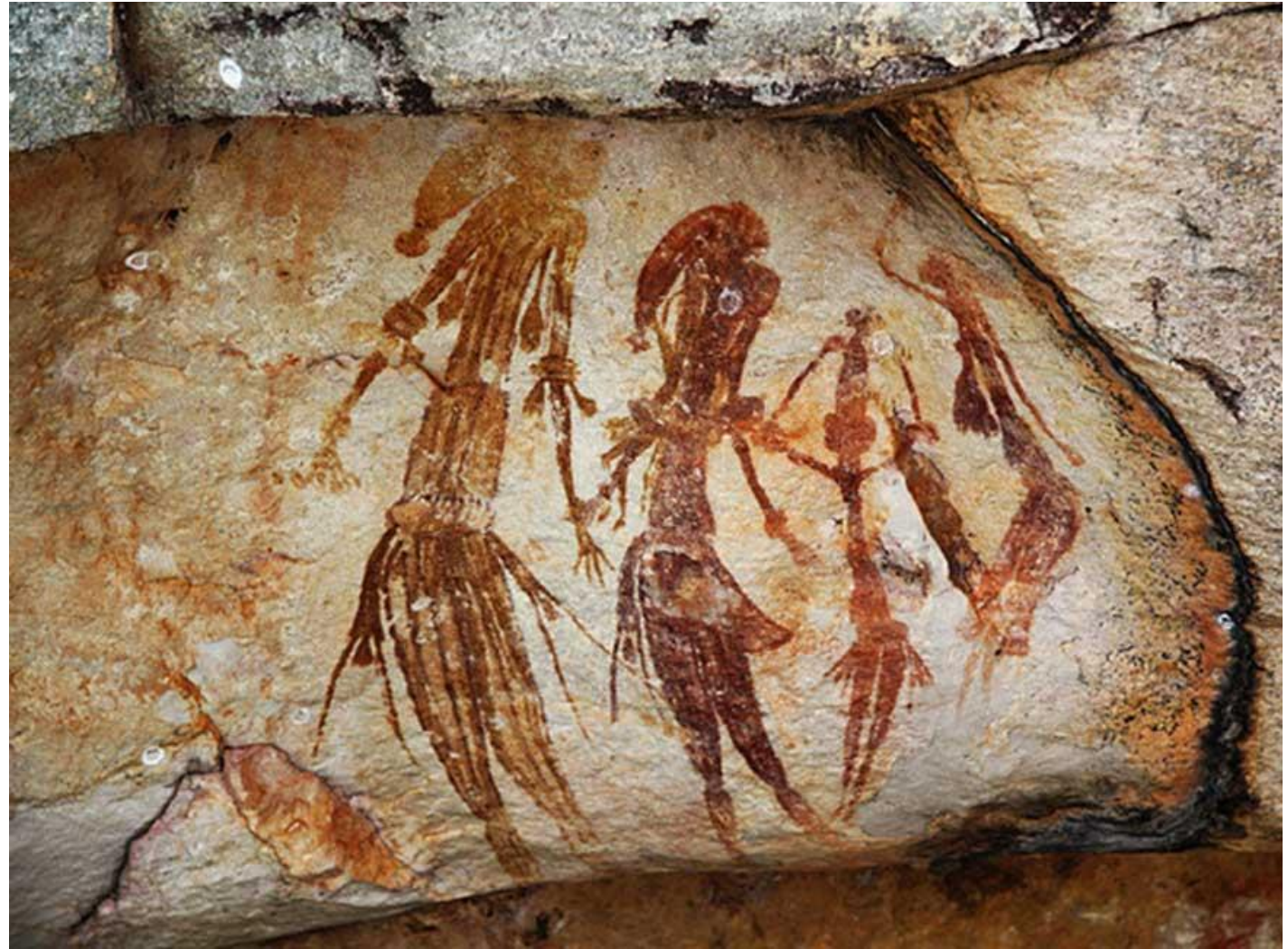
Pintura rupestre Bradshaw 26.000 años