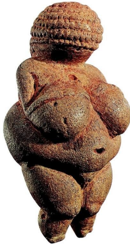
Venus de Willendorf (24 000 a. C.)

Sobre la evolución de la conciencia humana