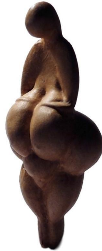
Venus de Lespugne (25 000 a. C.)